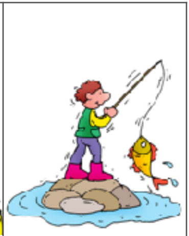
4. un pêcheur