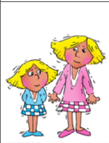
6. deux soeurs