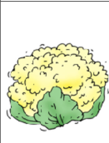
10. le chou-fleur