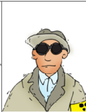
3. un aveugle