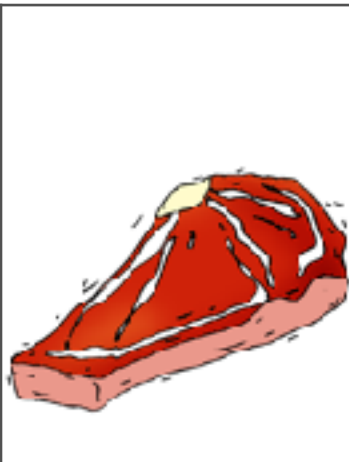
2. du boeuf